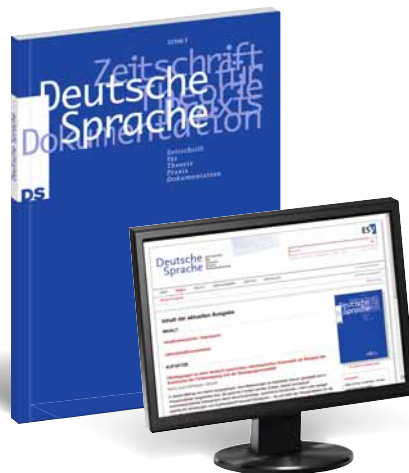
Deutsche Sprache Zeitschrift für Theorie, Praxis, Dokumentation in Print- und digitaler Ausgabe: www.DSdigital.de