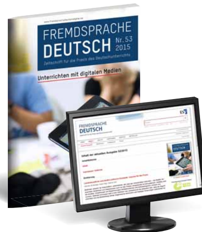
Fremdsprache Deutsch Zeitschrift für die Praxis des Deutschunterrichts in Print- und digitaler Ausgabe: www.FremdspracheDeutschdigital.de

Angebote zum Kombipreis für Ihre ergänzende Platzierung stellen wir gerne zur Verfügung: Anzeigen@ESVmedien.de