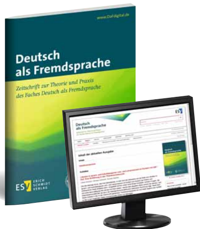
Deutsch als Fremdsprache Zeitschrift zur Theorie und Praxis des Faches Deutsch als Fremdsprache in Print- und digitaler Ausgabe: www.DaFdigital.de