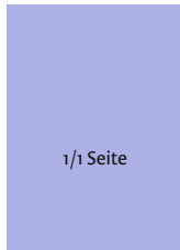
Anschnitt 210 mm x 297 mm