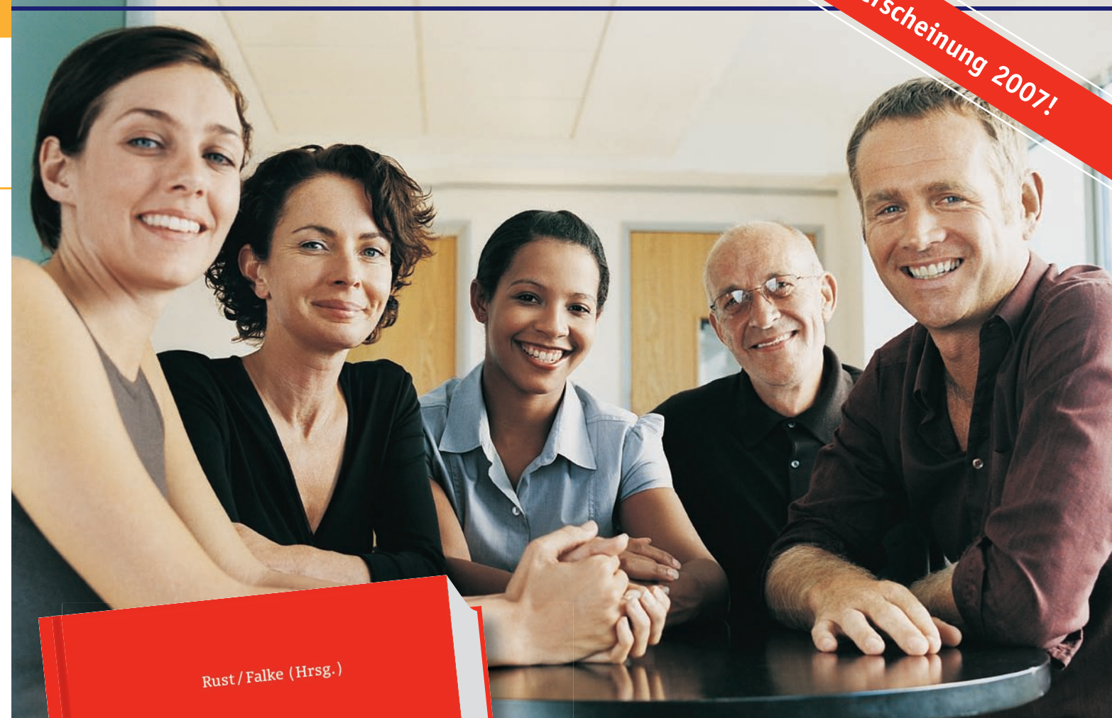
Preise z. Zt. der Drucklegung des Prospektes. Änderungen vorbehalten. 7/07

Weitere Informationen online unter www.ESV.info/978 3 503 09762 3